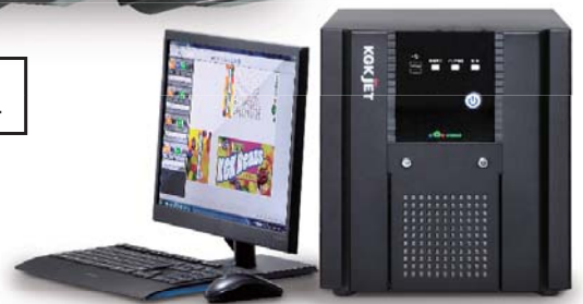
▲モニター・コントローラー