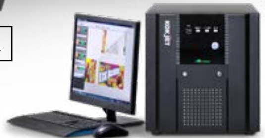
▲モニター・コントローラー